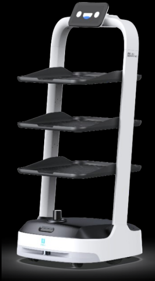
Pudubot 2 8.900€