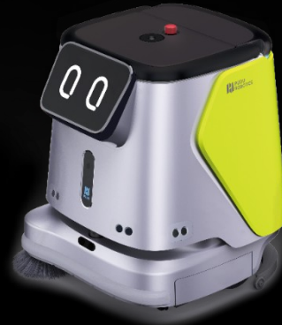
CC1 Reinigungsroboter 18.900€